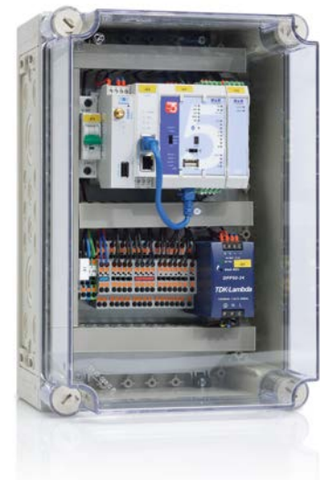
Anlage mit Vorgabe durch Sollwerte zur feinen Abstimmung der Energie

Dieser Aufbau ist für den Einbau in Zählertafeln auf einer Pertinax-Platte zur Potentialtrennung ausgelegt. Zwei separate 230 V Netzteile stellen Versorgungs- und Meldespannung bereit. Die Wirkleistungsvorgabe mit entsprechender Rückmeldung erfolgt in den Stufen 0/30/60/100% über digitale Aus- bzw. Eingänge mit externen Koppelrelais. Die Netztrennung kann sowohl durch einen Befehl aus der Leitstelle als auch aus Berechnung resultieren. Hierfür wird aus dem SO-Impuls des Zählers die tatsächliche Wirkleistung in 15-Minuten-Intervallen berechnet und mit dem vertraglich festgelegten Anschlusswert verglichen. Bei einer Überschreitung dieses Wertes erfolgt die Netztrennung durch ein bistabiles Relais. Der so erzeugte Netztrennbefehl kann nur vor Ort zurückgesetzt werden.