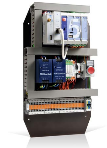
Anlage mit Soll-Ist-Abgleich und automatischer Netztrennung

Eine Besonderheit dieser Konstellation ist die standardisierte Verdrahtung auf Harting-Stecker. Dies erlaubt einen extrem einfachen und schnellen Anschluss der Fernwerkstation.