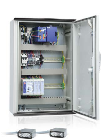
Anlage mit cleverer Anschlussmöglichkeit bei variablem Mengengerüst

In einem abschließbaren Rittal-Schrank werden für die Vorgabe der Leistungsstufen 4 bzw. 11 Einzelbefehle (ab 5 kVA Anlagennennleistung) verwendet. Die Rückmeldung erfolgt durch die entsprechende Anzahl an Einzelmeldungen. Auch der Netz-trennbefehl „Not-Aus“ und dessen Rückmeldung sind digital realisiert. Die Messung der Ist-Einspeisung von P, Q und U erfolgt durch drei separate Messwerte. Die Blindleistung wird mit drei Einzelbefehlen in den Stufen untererregt, neutral und übererregt vorgegeben und durch Einzelmeldungen zurückgemeldet.