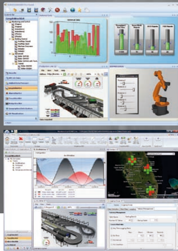
> HMI/SCADA und Business Visualisation

... mit Markenqualität führender Hersteller.